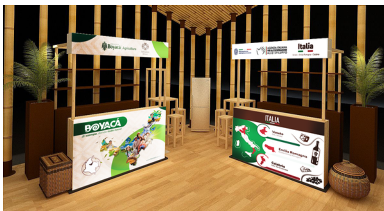
Renders de parte interna del stand Italia - Colombia en la zona "Tierra para todos", ubicada en el Baluarte San Ignacio.